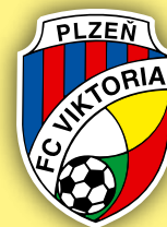
30. kolo ?