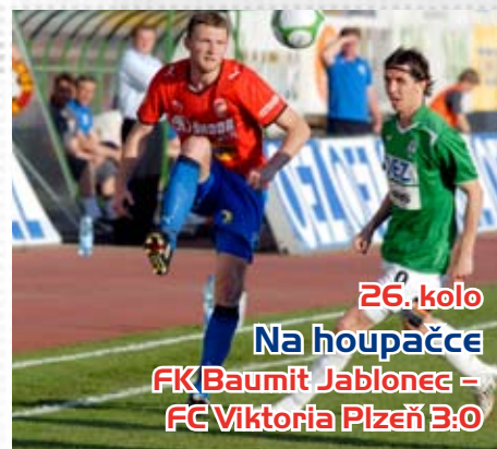
26. kolo Na houpačce FK Baumit Jablonec – FC Viktoria Plzeň 3:0

Podle očekávání velmi tuhý odpor kladli v Plzni fotbalisté ze Střížkova. Začátek druhé půle však rozhodl o třech bodech pro domácí.