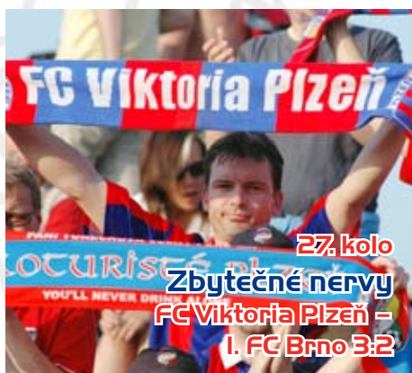
27. kolo Zbytečné nervy FC Viktoria Plzeň – I. FC Brno 3:2

Věrní fanoušci z Plzně nevěřili na jablonecké Střelnici vlastním očím. Domáci byli lepší ve všech herních činnostech, rozdíl ve skóre mohl být větší.