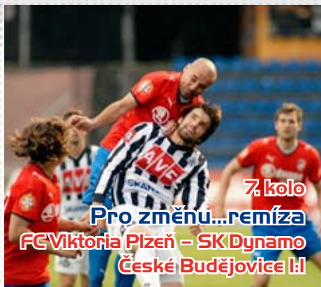
7. kolo Pro změnu...remíza FC Viktoria Plzeň – SK Dynamo České Budějovice 1:1

Spousta šancí, převaha, ale opět pouze remíza. Sázkaři měli z Viktorie radost, Plzeňští si připsali pátou remízu v sedmém utkání.