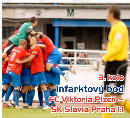
3. kolo Infarktový bod FC Viktoria Plzeň – SK Slavia Praha 1:1

Ve druhém utkání sezony brali domácí body právem. Plzeň neudržela vedení a tempo z první půle, o výsledku rozhodl krásnou střelou Kazár.