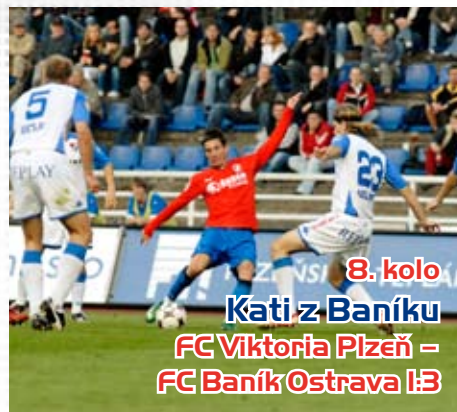
8. kolo Kati z Baníku FC Viktoria Plzeň – FC Baník Ostrava 1:3

Spousta šancí, převaha, ale opět pouze remíza. Sázkaři měli z Viktorie radost, Plzeňští si připsali pátou remízu v sedmém utkání.