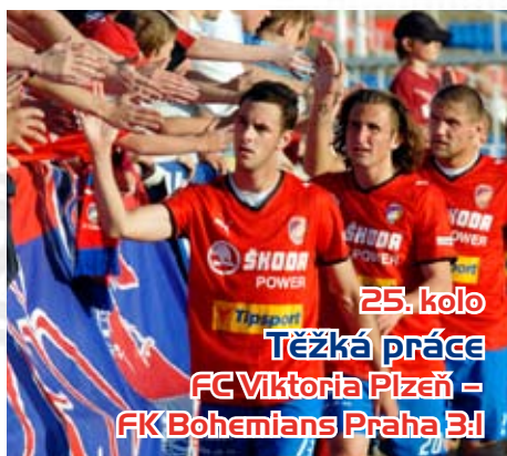
25. kolo Těžká práce FC Viktoria Plzeň – FK Bohemians Praha 31

Podle očekávání velmi tuhý odpor kladli v Plzni fotbalisté ze Střížkova. Začátek druhé půle však rozhodl o třech bodech pro domácí.