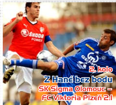
2. kolo Z Hané bez bodu SK Sigma Olomouc – FC Viktoria Plzeň 2:1

Před více než sedmi tisícovkami diváků si posílená Plzeň připsala první vítězství. Proti pražské jmenovkyni byli viktoriáni lepším týmem.