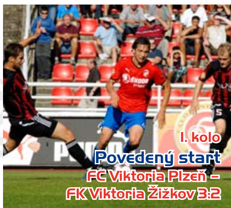
1. kolo Povedený start FC Viktoria Plzeň – FK Viktoria Žižkov 3:2

Před více než sedmi tisícovkami diváků si posílená Plzeň připsala první vítězství. Proti pražské jmenovkyni byli viktoriáni lepším týmem.