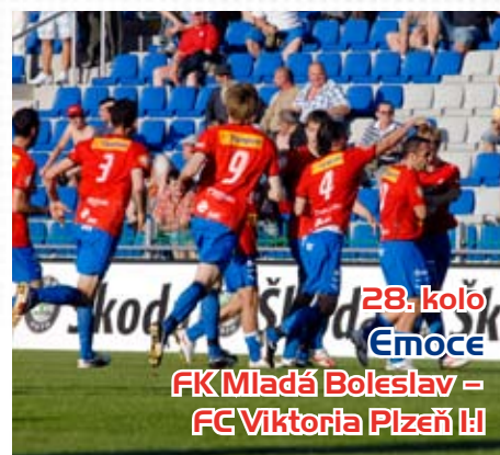
28. kolo Emoce FK Mladá Boleslav – FC Viktoria Plzeň 1:1

Krásné góly a jasné vedení, následně hektický závěr. Velký nervák přichystali viktoriáni svým fanouškům. Nakonec však tři body zůstaly doma.