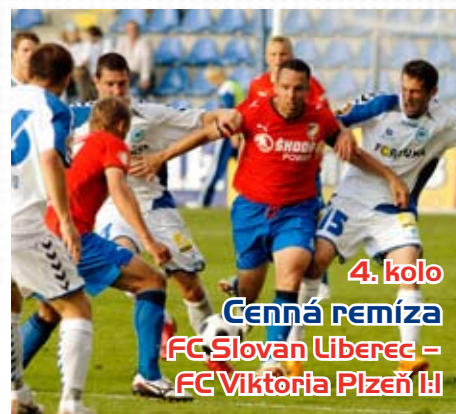
4. kolo Cenná remíza FC Slovan Liberec – FC Viktoria Plzeň 1:1

Druhý domácí zápas, opět skvělá návštěva a zasloužený bod s úřadujícím mistrem. Viktoria i v deseti dokázala srovnat v poslední minutě.