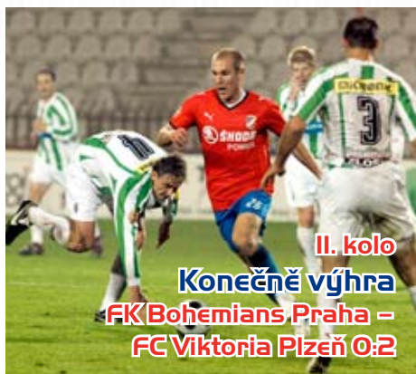
11. kolo Konečně výhra FK Bohemians Praha – FC Viktoria Plzeň 0:2