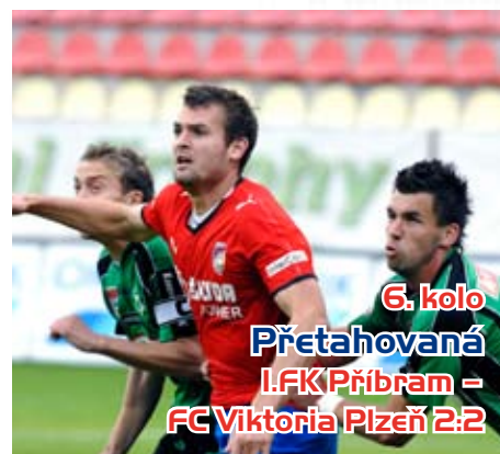
6. kolo Přetahovaná 1. FK Příbram – FC Viktoria Plzeň 2:2

Opět sedmitisícová návštěva, která se však tří bodů nedočkala. viktoriáni byli lepším týmem, ale v koncevce zklamali.