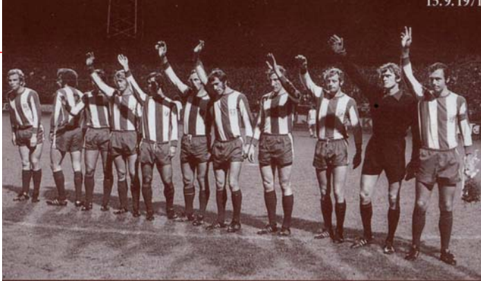
Hráči slavného Bayernu Mnichov zdraví zcela plné Štruncovy sady. Vpravo největší hvězdy - kapitán Franz Beckenbauer a brankář Sepp Maier.

zeň nestačila na hvězdnou Trnavu (1:2, 1:5), ale protože ta startovala v Poháru mistrů evropských zemí, zahrála si Škodovka v září v PVP proti Bayernu Mnichov.