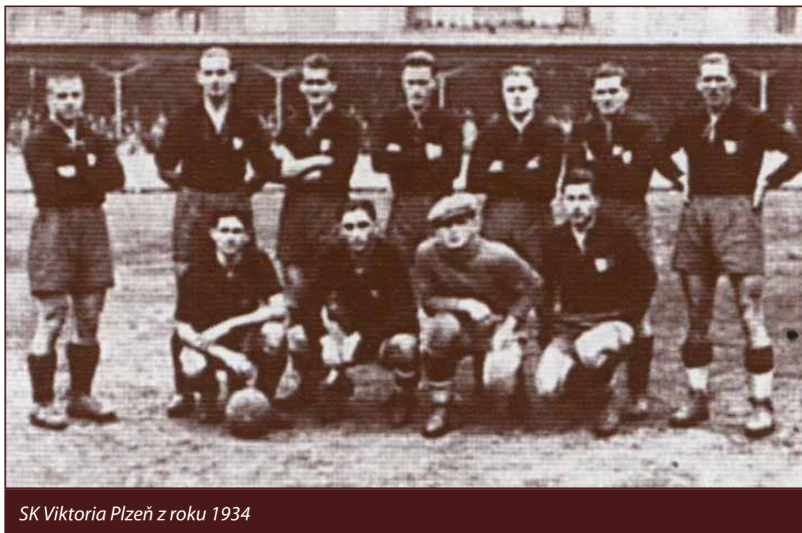
SK Viktoria Plzeň z roku 1934