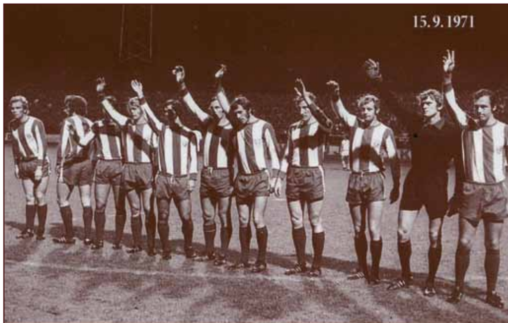
Hráči slavného Bayernu Mnichov zdraví zcela plné Štruncovy sady. Vpravo největší hvězdy – kapitán Franz Beckenbauer a brankář Sepp Maier.

A los byl opět nemilosrdný. Hned v prvním kole Škodovce určil Bayern Mnichov, mužstvo z výkvetu světového fotbalu. Veřejnost měla obavy z debaklu, protože sestoupivší Škodě se příliš nedařilo ani ve druhé lize. První utkání se hrálo v září 1971 v Plzni a byl o něj obrovský zájem. Už dlouho před utkáním přicházely objednávky na vstupenky z různých míst republiky. Hodně zájemců bylo i z Bavorska. Hrálo se ve Štruncových sadech za umělého osvětlení před návštěvou 30 000 diváků! Mužstva nastoupila v obvyklých sestavách. BAYERN: Maier – Hansen, Schwarzenbeck, Beckenbauer, Breitner – Zobel, Roth, Schneider – Hoe-