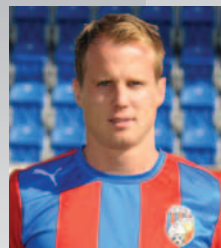
David Limberský 8 6. 10. 1983 Post obránce Prvoligové starty 183 Prvoligové branky 14