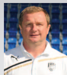
Pavel Vrba 6. 12. 1963 hlavní trenér