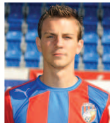
Vladimír Darida 16 8. 8. 1990 Post záložník Prvoligové starty 29 Prvoligové branky 3