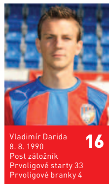
Vladimír Darida 16 8. 8. 1990 Post záložník Prvoligové starty 33 Prvoligové branky 4