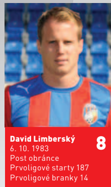
David Limberský 8 6. 10. 1983 Post obránce Prvoligové starty 187 Prvoligové branky 14