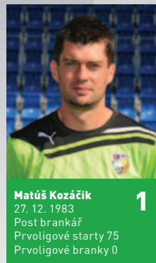
Matuš Kozáčík 1 27. 12. 1983 Post brankář Prvoligové starty 75 Prvoligové branky 0