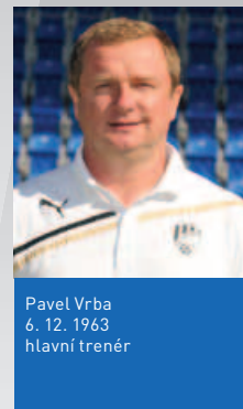
Pavel Vrba 6. 12. 1963 hlavní trenér