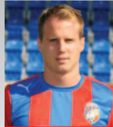
David Limberský 8 6. 10. 1983 Post obránce Prvoligové starty 189 Prvoligové branky 14