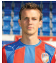
Vladimír Darida 16 8. 8. 1990 Post záložník Prvoligové starty 35 Prvoligové branky 4