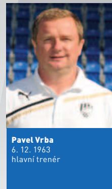
Pavel Vrba 6. 12. 1963 hlavní trenér