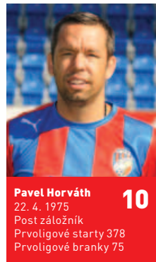
Pavel Horváth 10 22. 4. 1975 Post záložník Prvoligové starty 378 Prvoligové branky 75