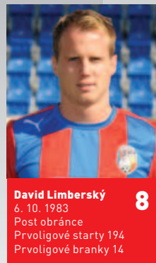
David Limberský 8 6. 10. 1983 Post obránce Prvoligové starty 194 Prvoligové branky 14