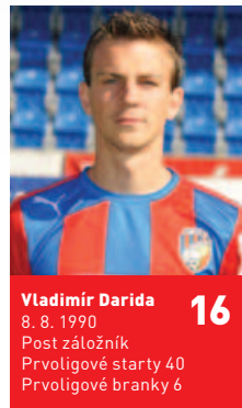
Vladimír Darida 16 8. 8. 1990 Post záložník Prvoligové starty 40 Prvoligové branky 6